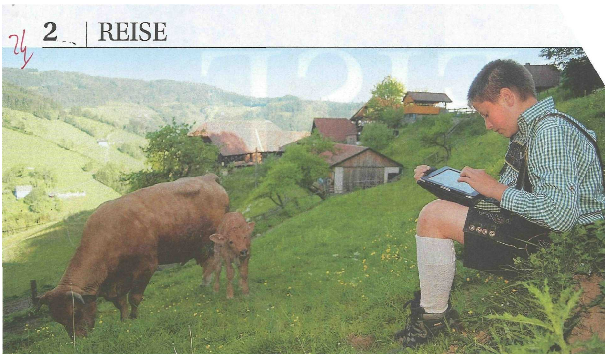
Auf der Alm gibt's ka Web: Derzeit versorgen die Leih-iPads nur offline mit Infos