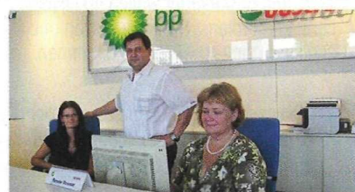
Wisag bietet der BP-Niederlassung in Wiener Neudorf sämtliche FM-Dienstleistungen aus einer Hand.