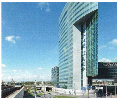
HSG Zander betreut im Wiener Tech Gate eine Gesamtfläche von 54.000 m 2 .

Zielsetzung ist es, den hier angesiedelten Firmen durch die örtliche Konzentration von erfolgreichen und innovativen Technologieunternehmen und Forschungseinrichtungen Synergien zu ermöglichen und Vernetzungen zu intensivieren. Die vermieteten Büroflächen reichen von 35 bis rund 4800 m 2 . Für das technische und infrastrukturelle FM sowie Property- und Projektmanagement zeichnet seit 2004 HSG Zander verantwortlich. Insgesamt betreut die Bilfinger-Berger-Tochter im Tech Gate eine Fläche von 54.000 m 2 .