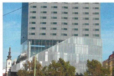
Prestigeauftrag für Strabag FM: das Sofitel am Wiener Donaukanal.