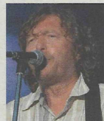
14. August: Peter Cornelius & Band.