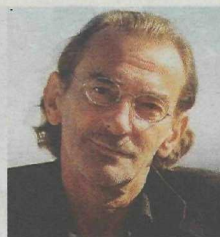
15. Juli: Ludwig Hirsch & Band.

Nähere Infos im Internet auf www.mariazeller-bergwelle.at .