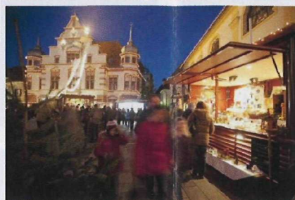
Advent streirisch, stimmungsvoll: In Mariazell vor der Basilika (oben), in Hart- berg am Haupt- platz (rechts)

chenhaus „einchecken“. 35 reisiggeschmückte Marktstände aus Fichtenholz bieten traditionellen Christbaumschmuck und geschnitzte Krippen, hausgemachte Weihnachtsbäckerei, Lebkuchenspezialitäten und feinen Orangenpunsch. Auf der Weiterreise ließen sich stille Spuren im Schnee ziehen! In der „Romantik Skiregion“ mit Alpl, Lammeralm und Mariazeller Bürgeralpe etwa. „Von Hütte zu Hütte“ lautet das Motto der Aflenzner Bürgeralm, wo Skitouren für Profis und Anfänger angeboten werden. Traditionell zeigen sich auch die Adventmärkte in Peter Roseggers Waldheimat mit zahlreichen Handwerksständen und hochsteirischen Köstlichkeiten wie Apfelbrot oder Schwarzkugelstrudel. Last but not least lockt der Lichter- und Weihnachtszauber in Hartberg bis 23.12.!