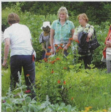
Die Garten Tulln

Info: Tel.: 02272/681 88, www.diegartentulln.at